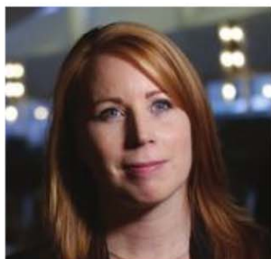
Annie Lööf, partiledare (C): "Jobb och företag är nyckeln. Det behöver bli enklare och billigare att starta och driva företag. Vi vill sänka kostnaderna och minska