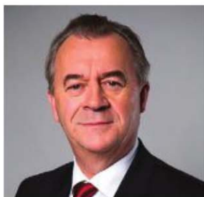
Sven-Erik Bucht, landsbygdsminister (S): "Regeringens viktigaste prioriteringar för regional tillväxt är innovation och företagande, attraktiva miljöer och tillgänglighet, kom-