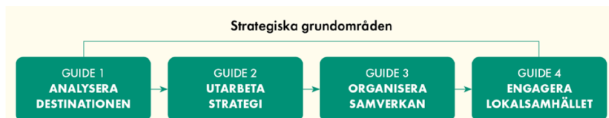
Figur 1: Guide 1: analysera destinationen. Guide 2: utarbete strategi. Guide 3: organisera samverkan. Guide 4: engagera lokalsamhället.

Under uppdragets gång förstärktes bilden att den metod som beskrivs i Handbok för turismutveckling i världsarv och andra kulturmiljöer täcker in de byggstenar som Tillväxtverket identifierat som viktiga för att genom platsutveckling utveckla en hållbar turism och besöksnäring. Genom att gå igenom guiderna i metoden vägledades alla involverade aktörer i att skapa en gemensam bild av platsens förutsättningar, möjligheter och eventuella målkonflikter.