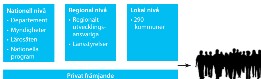
Figur 1 Främjandesystemets huvudmän

Det statligt finansierade främjandesystemets främsta huvudman är regeringen som genom departementen verkställer politiken via olika myndigheter på nationell och regional nivå. På den regionala nivån finns förutom myndigheter även organisationer med ett regionalt utvecklingsansvar. På lokal nivå ger kommunallagen Sveriges 290 kommuner möjlighet att arbeta med företagsfrämjande åtgärder.