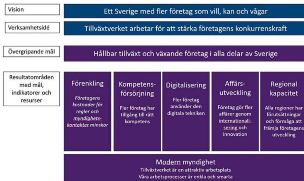
Bild 1, resultatredovisningens indelning

Syftet med denna indelning är att ge regeringen en tydlig återrapportering utifrån deras uppställning i regleringsbrevet. Under respektive mål har vi gjorts ett urval utifrån våra program/insatser som ger en rättvisande bild av vår verksamhet inklusive våra prestationer i tre avsnitt - a-c, enligt bild 1.