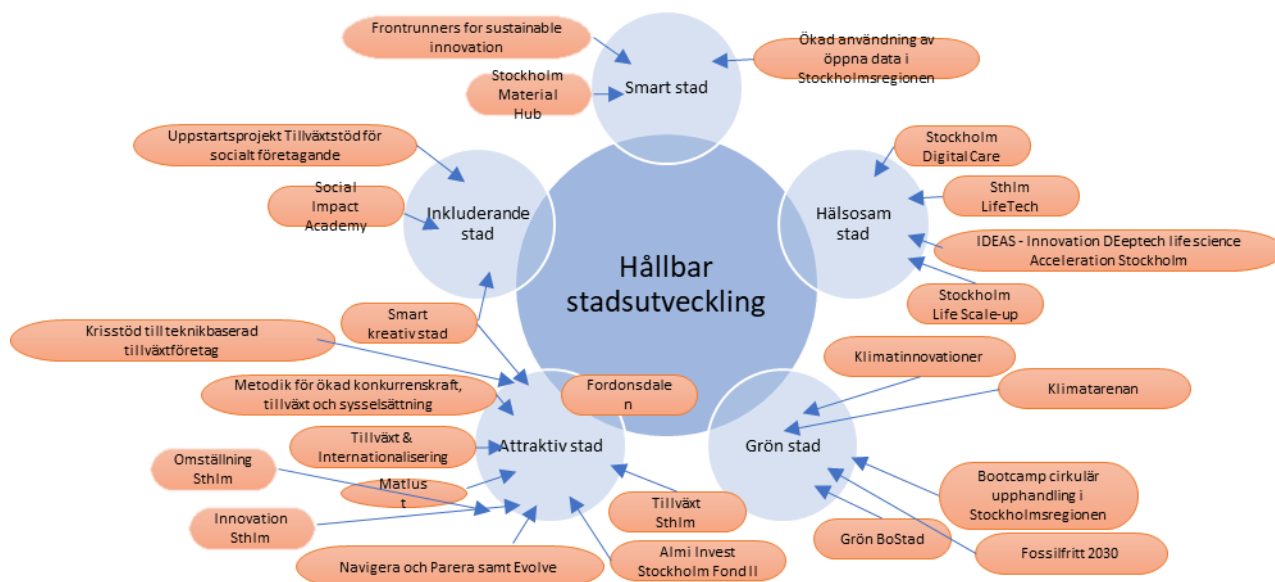
Figur 7. Projektens koppling till utpekade styrkeområden