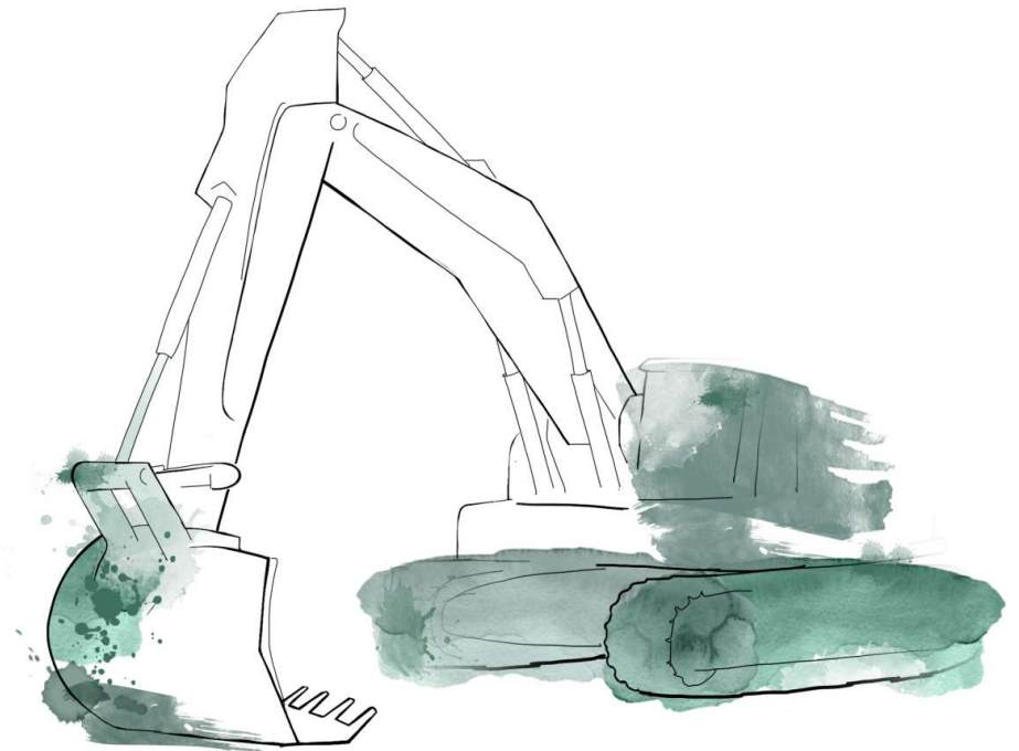
Illustration: Itziar Castany Ramirez