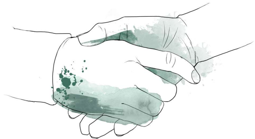
Illustration: Itziar Castany Ramirez