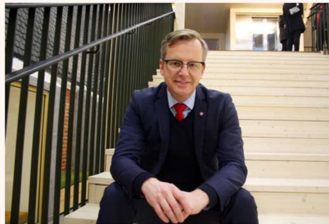
Mikael Damberg

Publicerad fredag 24 februari, Av Lars Westerlund